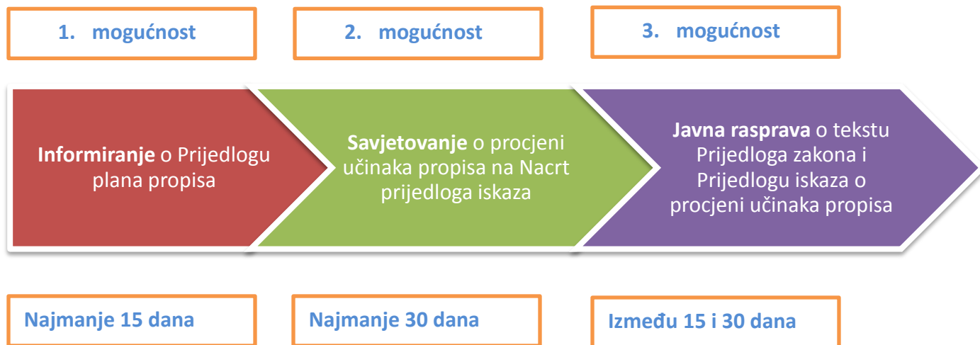
Slika 2.: Tri mogućnosti sudjelovanja javnosti u postupku procjene učinaka propisa

Postupak procjene učinaka propisa daje ukupno tri mogućnosti za sudjelovanje dionika, zainteresirane javnosti i javnosti, što je prikazano na slici 2 . Pored informiranja o Prijedlogu plana propisa, druga mogućnost je sudjelovanje u savjetovanju s javnošću i zainteresiranom javnošću o Nacrtu prijedloga iskaza u trajanju od 30 dana . Treća mogućnost je sudjelovanje u javnoj raspravi o propisu i Prijedlogu iskaza u trajanju od najmanje 15 do najviše 30 dana .